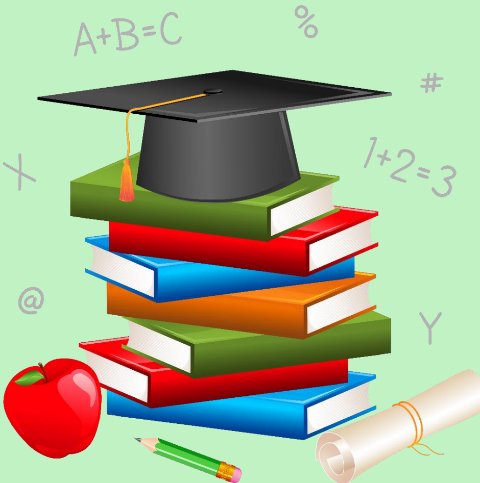
Прийняті на навчання закладами вищої освіти за джерелами фінансування їх навчання у 2021 році (відсотків)