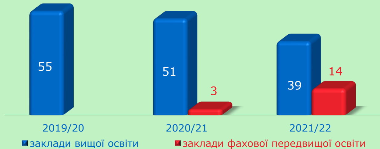
Кількість студентів у закладах вищої освіти (на початок навчального року, тис.)