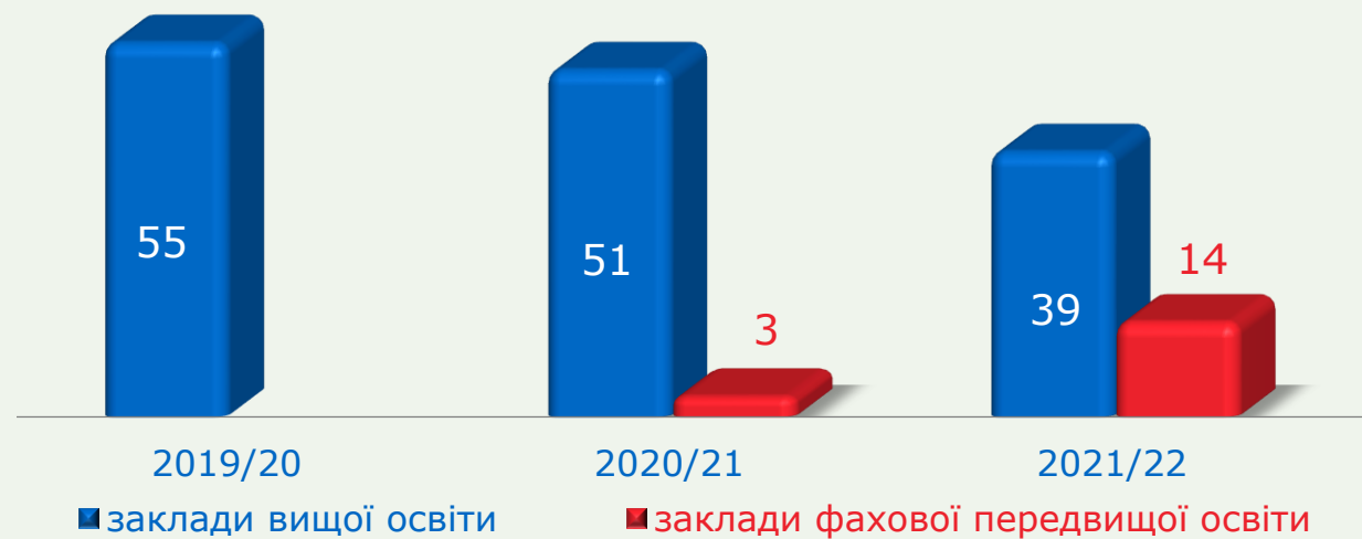
Заклади вищої освіти (на початок навчального року)