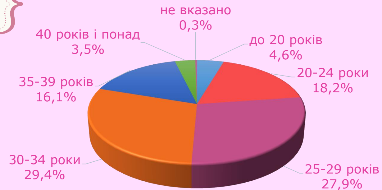
Розподіл живонароджених за віком матерів у 2021 році

Найбільш активними дитородними групами у 2021 році були жінки віком 30–34 років та 25-29 років. Середній вік матерів при народженні дитини дорівнював 29,3 року